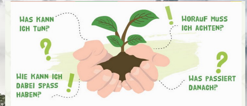
Graphik von Abenteuer Regenwald e.V.

Die Regenwälder der Erde sind so weit weg und doch so nah.